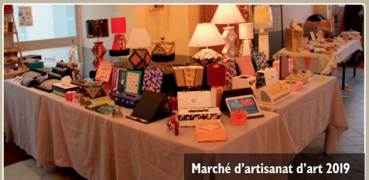
Marché d'artisanat d'art 2019